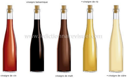
vinaigre balsamique vinaigre de riz vinaigre de vin vinaigre de malt vinaigre de cidre